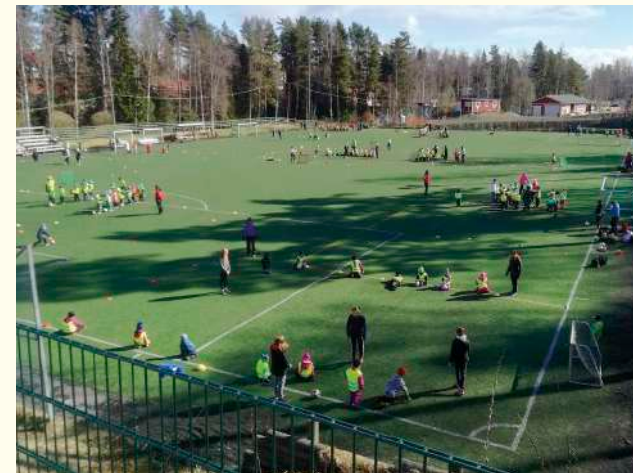
Keväisin järjestämme kaksipäiväisen tapahtuman päiväkotilaisille.

Ett stort tack till de energiska eleverna i Kasabergets högstadieskola!