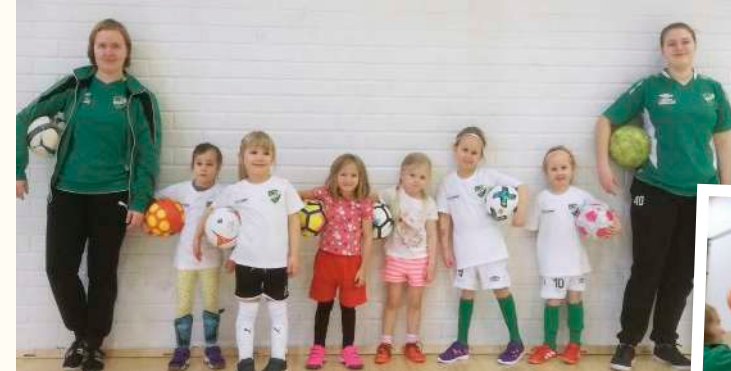
Tytöt 2011-2013 ja valmentajat.

Tytöt 2011-2013 harjoittelevat talvella Kasavuoren koulun juhlasalissa lauantaisin klo 11-12. Kesäkaudella pelataan ulkona.