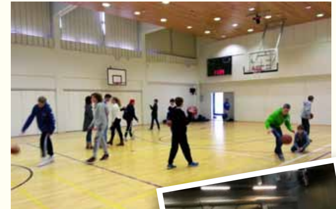
Kasavuoren koululla tiistaisin klo 11-12

Rastgymnastik är en gång i veckan i Kasabergets skola. Barnen är skapade att röra på sig och då de sitter under skoldagen packar sig energin. I rastklubbarna har jag märkt att barnen har mängder med energi som måste få sitt utlopp