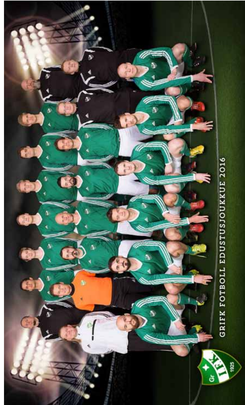
GRIFK FOTBALL EDUSTUSJOUKKUE 2016