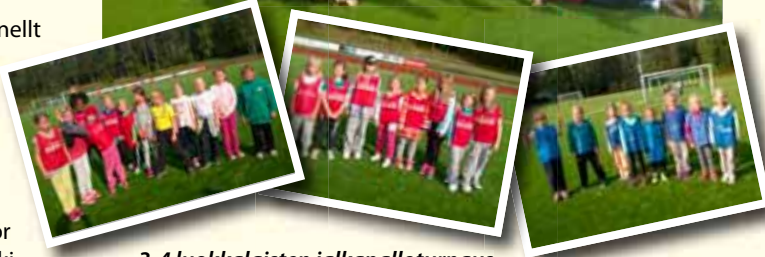
3-4 luokkalaisten jalkapalloturnaus elokuussa keskus kentällä.

Katso lisää tapahtumista GrIFK kotisivuilta