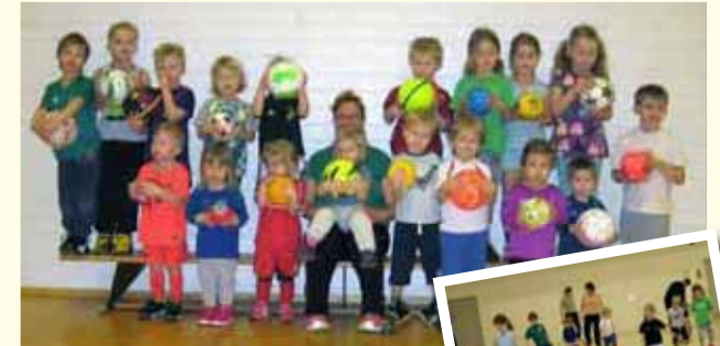
Lauantaisin klo 10-11 yhteistä pallokivaa vanhempien seurassa.

Vi bekantar oss med fotbollens grunder med små 3-5 åringar (och deras föräldrar) genom lek på lördagsmornar. På hösten fortsätter vi så ta mod till dig och kom med!