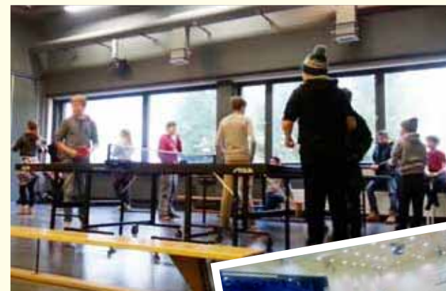
Kasavuoren koululla Tiistaisin klo 11-12

Kasavuoren koululla on välitunti liikuntaa kerran viikossa. Lapset on luotu liikkumaan ja koulupäivän aikana energia pakkautuu istuessa. Välituntikerhoissa olen huomannut, että lapsilla on hurjasti energiaa, jota täytyy päästä purkamaan välitunneilla. Parasta on siis antaa heille siihen mahdollisuus! Kasavuoressa pelaamme mm. salibandya ja futista salissa.