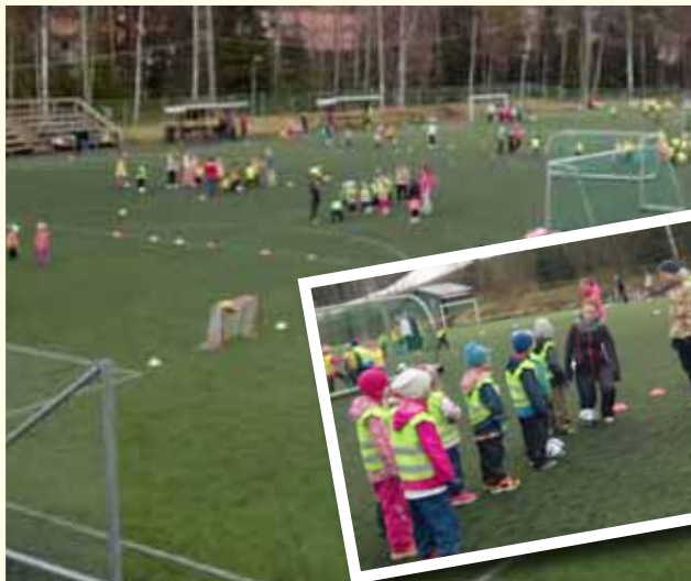
Keväisin järjestämme tapahtuman päiväkotilaisille.

Ett stort tack till de energiska eleverna i Kasabergets högstadies!