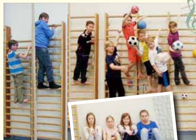
Granhultin koululla Tiistaisin klo 15-16

Musafotis har fungerat sedan 2011 i Granhultsskolan på tisdagar. Basiden är att leka med bollar i takt med musik och annan motion som utvecklar koordination och motorik. Vi använder bl.a. ringar, rep och trampa.