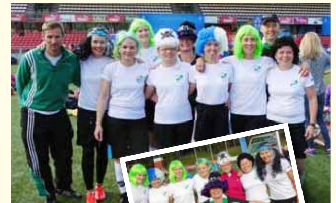
Lauantaisin klo 11-12